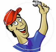
MECHANIK-MONTER MASZYN I URZĄDZEŃ