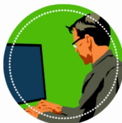
OPERATOR OBRABIAREK SKRAWAJĄCYCH