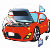
MECHANIK POJAZDÓW SAMOCHODOWYCH