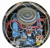
ELEKTROMECHANIK POJAZDÓW SAMOCHODOWYCH