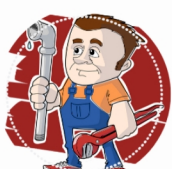
MONTER SIECI I INSTALCJI SANITARNYCH